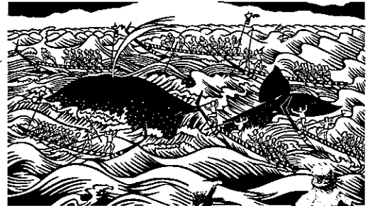
切り絵「商人の日記帳」 (陶山広之作)より鯨漁