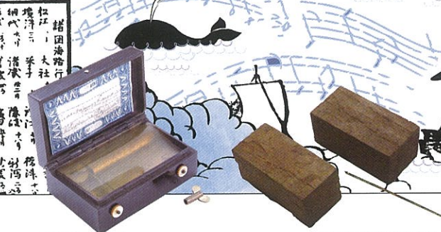
日本最古のオルゴール 【重要有形民俗文化財 美保神社奉納贈物オルゴール (美保神社蔵) (展示期間10月1日(日)まで)】 美保神社で行われた宝くじの札 【宝くじの木駒】