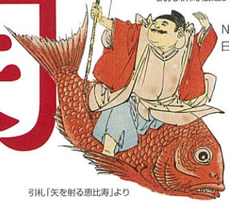
引札「矢を射る惠比寿」より

主催/松江歴史館 後援/鳥根県、鳥根県教育委員会、山陰中央新報社、朝日新聞松江総局 産経新聞松江支局、日本経済新聞社松江支局、毎日新聞松江支局 読売新聞松江支局、中国新聞社、鳥根日日新聞社、新日本海新聞社 共同通信社松江支局、時事通信社松江支局 NHK松江放送局、TSK山陰中央テレビ、BSS山陰放送 日本海テレビ、山陰ケーブルビジョン、エフエム山陰