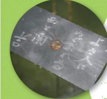
八重垣神社 鏡の池