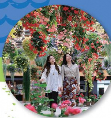
フォーゲルパーク